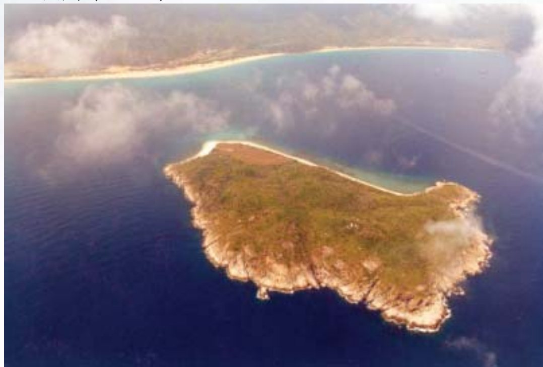
从空中看海岛（大陆岛）