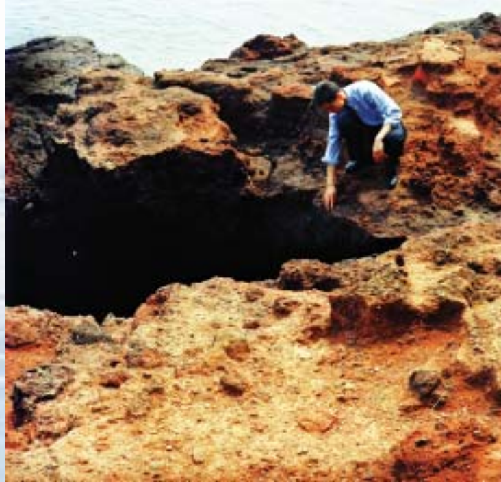
广西涠洲岛火山岩