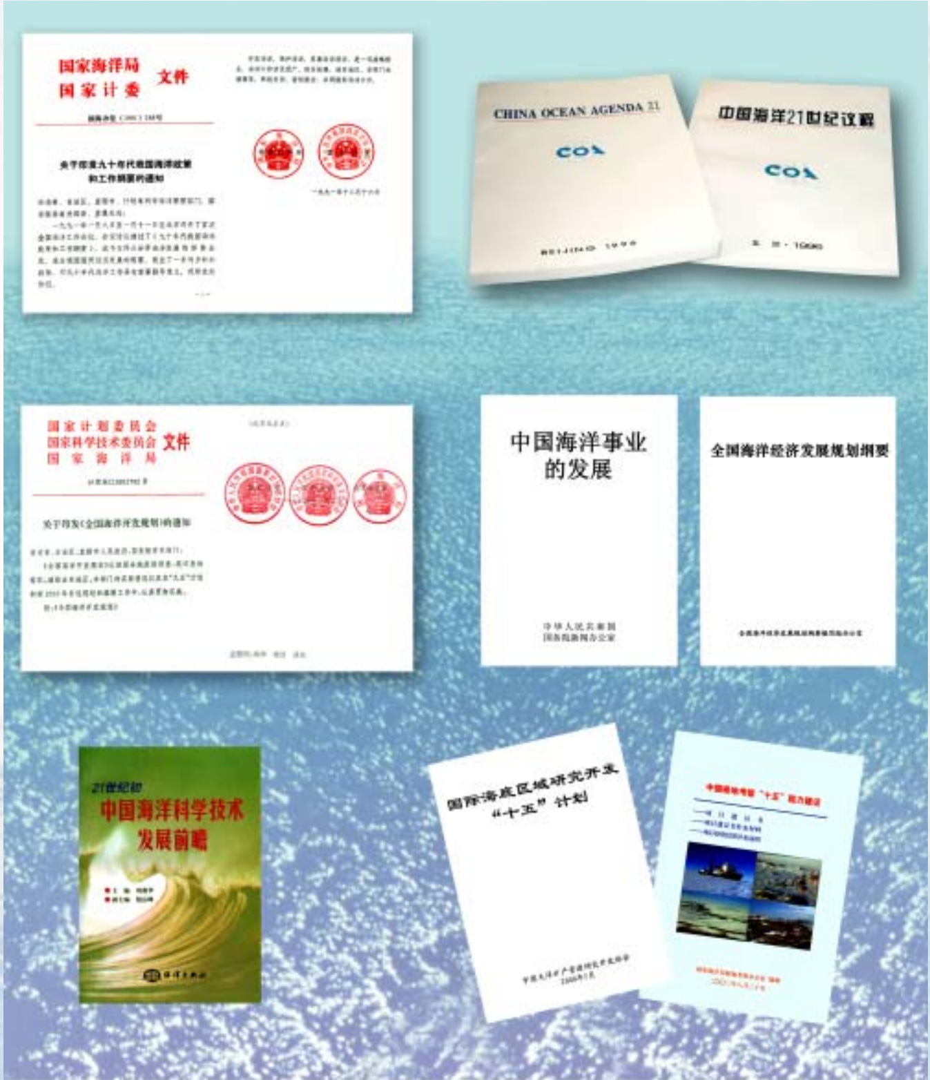
制定的各类政策和规划

新中国成立以来特别是改革开放以来，全国人民代表大会先后颁布了《中华人民共和国领海及毗连区法》、《中华人民共和国大陆架和专属经济区法》、《中华人民共和国海洋环境保护法》、《中华人民共和国海域使用管理法》、《中华人民共和国海上交通安全法》、《中华人民共和国渔业法》等海洋管理法律。国务院制定了《对外合作开采海洋石油资源条例》、《海洋倾废管理条例》、《涉外海洋科学调查研究管理规定》、《铺设海底电缆管道管理规定》和《矿产资源勘查区块登记管理办法》等行政法规。这些法律、行政法规的制定和实施，既维护了国家主权和海洋权益，也促进了海洋资源的合理开发和海洋环境的有效保护，使我国万里海疆的海洋综合管理逐步走上法制化轨道。特别是《中华人民共和国海域使用管理法》的实施，开始扭转了海域使用中“无序、无度、无偿”的“三无”局面。 国家根据建设海洋强国的需要，先后拟订了《我国海洋发展中长期规划》、《全国海洋开发规划》、《中国海洋21世纪议程》、《全国海洋功能区划》等。特别是2003年5月，国务院发布了《全国海洋经济发展规划纲要》，这是落实“实施海洋开发”战略的一个重大举措，标志着我国海洋事业进入了一个新的阶段。